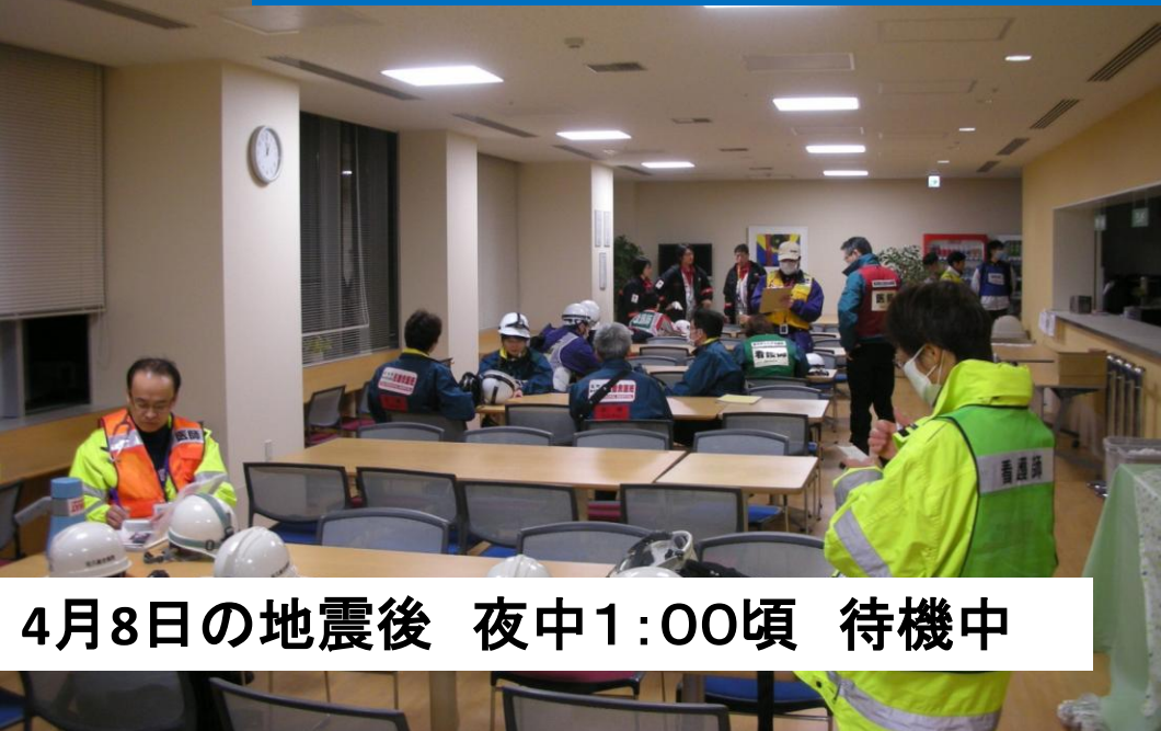
4月8日の地震後 夜中1:00頃 待機中