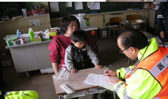
学校内で診療を行う様子