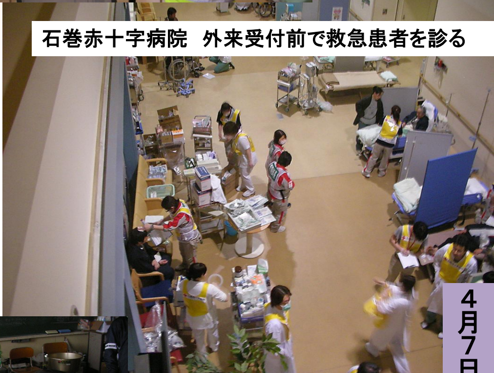
石巻赤十字病院 外来受付前で救急患者を診る