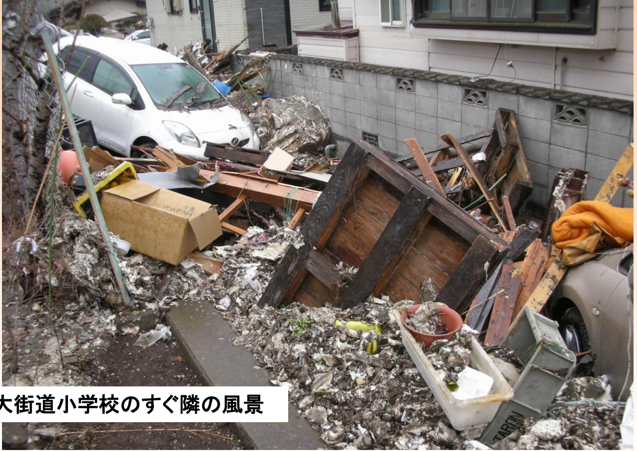
大街道小学校のすぐ隣の風景