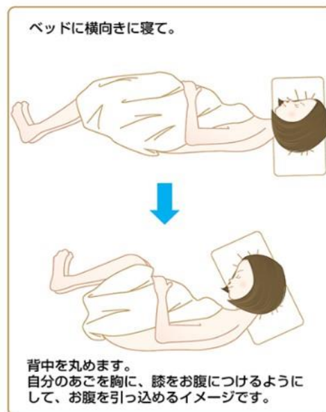
横向きに寝て背中から麻酔をする時の姿勢