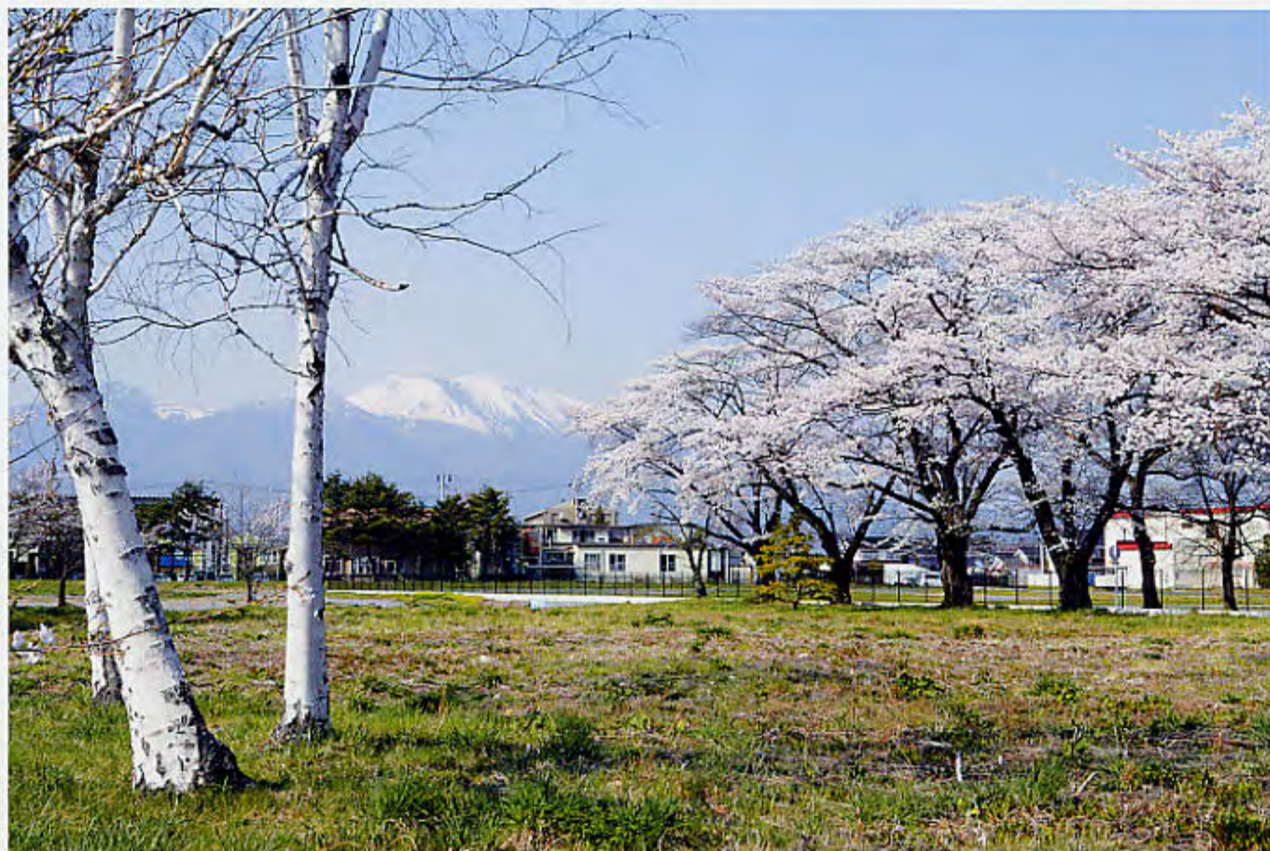
高度医療センター建設予定地